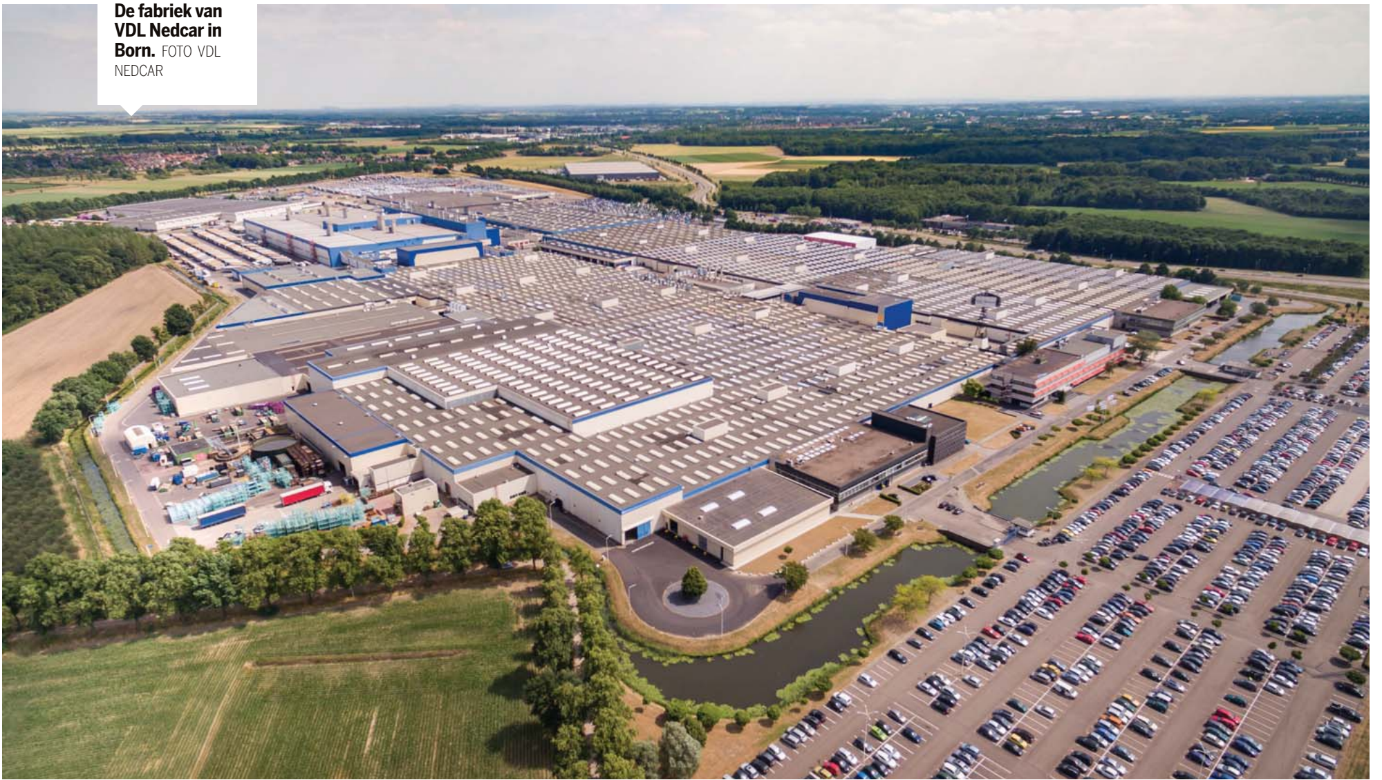
De fabriek van VDL Nedcar in Born.