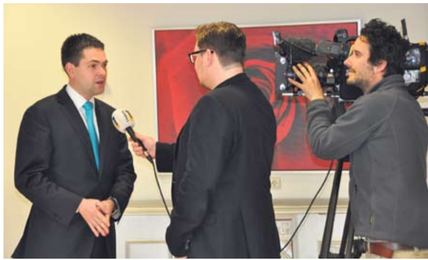
Fractievoorzitter Joost van den Akker staat de pers te woord.